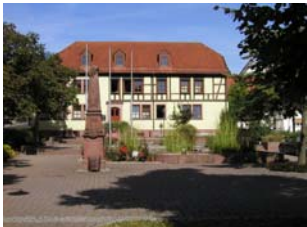
Großrinderfeld bietet Interessantes für Kinder.

Die Kenntnis der Teilnehmerzahl hilft uns, die Veranstaltung optimal zu organisieren. Wir bitten Sie daher um kurze Anmeldung. Dies kann via email an rgerhards@adiscon.com (bevorzugt) oder mittels der umseitigen Karte erfolgen. Bitte machen Sie von dieser Möglichkeit rechtzeitig gebrauch.